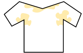
黄ばみを防ぐのには「しまい洗い」がおススメ

夏の衣服は、他の季節よりも気をつけないといけないポイントがあります。夏は汗をたくさんかくことで雑菌が増殖しやすくなるため、冬物の洋服に比べると汗や皮脂汚れが残っていることが多い傾向があります。そのまま保管してしまうと、黄ばみが出てしまう可能性が高くなります。黄ばみを防ぐには、衣替えでしまう前に、洋服をきれいに洗い直す「しまい洗い」がおススメです。大切な洋服を来年も気持ちよく着られるように、季節の変わり目に是非洋服のチェックをおススメします。